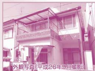
外観写真(平成26年9月撮影)