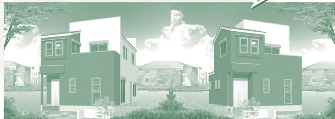
イメージハウス&イメージハウスにつき実際とは異なる場合がございます。