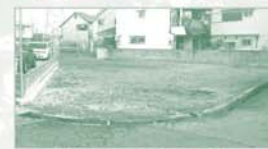
現況写真(平成26年3月撮影)