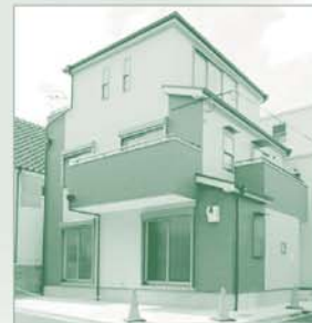
外観写真(平成26年3月撮影)